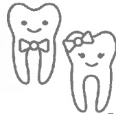
ÇOCUK DİŞ TEDAVİSİ